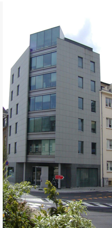
Transformation de l'immeuble Europe à Luxembourg-Limpertsberg (L)